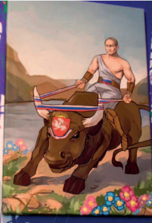
1. "Самодержавие, православие и народность" – Иван III Самодержавие, православие и народность – это три столпа, на которых зиждется государство. Самодержавие – это власть, которая принадлежит одному человеку, православию – это вера, а народность – это любовь к своему народу. Иван III – это человек, который объединил все это в одно целое. Он создал сильное государство, которое просуществовало до наших дней.